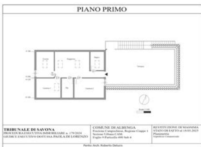
Albenga - Frazione Campochiesa - Regione Ciappe n. 1 - Piano 1 - Fg. 9 Part. 490 sub 4 - Planimetria Stato di fatto al 18.03.2025

Si riscontra una discordanza tra la planimetria catastale e la conformità urbanistico-edilizia dell'immobile, derivante da un errore di rilevamento. Tale difformità può essere sanata mediante la redazione di una nuova planimetria catastale, che rappresenti fedelmente lo stato attuale dell'immobile che è conforme ai titoli abilitativi urbanistico-edilizi rilasciati