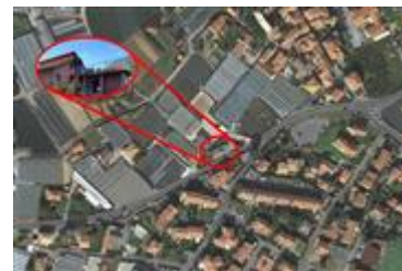
Albenga -Frazione Campochiesa -Regione Ciappe n 1 - Fg 9 Part 490 sub 4 -Inquadrimento Maps 2