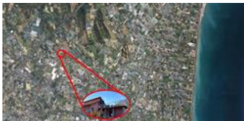
Albenga -Frazione Campochiesa -Regione Ciappe n 1 - Fg 9 Part 490 sub 4 -Inquadrimento Maps 1

I beni sono ubicati in zona rurale in un'area agricola, le zone limitrofe si trovano in un'area agricola (i più importanti centri limitrofi sono Alassio, Imperia, Ceriale, Borghetto S.S., Loano, Pietra Ligure, Finale Ligure, Vado Ligure, Savona). Il traffico nella zona è scorrevole, i parcheggi sono sufficienti. Sono inoltre presenti i servizi di urbanizzazione primaria e secondaria, le seguenti attrazioni storico paesaggistiche: Km. 4 Centro Storico di Albenga; Km. 3,5 - litorale - stabilimenti balneari Ceriale.