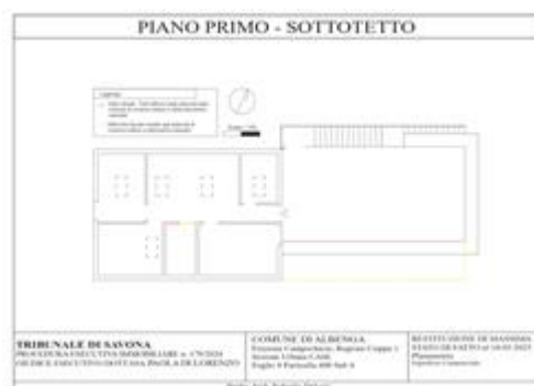
Albenga - Frazione Campochiesa - Regione Ciappe n. 1 - Piano 1 - Fg. 9 Part. 490 sub 4 - Planimetria DIFFORMITÀ'