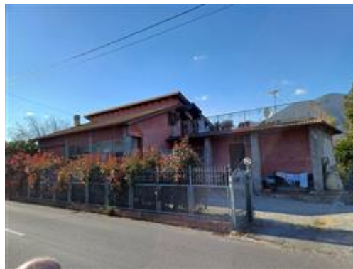
Esterni strada 2