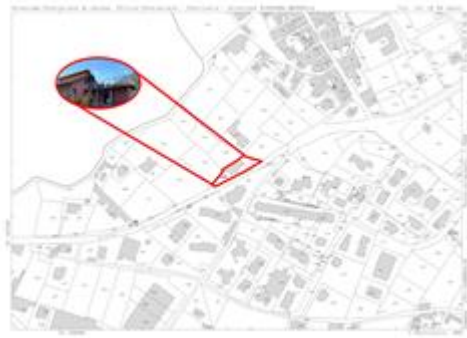
Albenga -Frazione Campochiesa -Regione Ciappe n 1 - Fg 9 Part 490 sub 4 -Inquadrimento Mappa Catastale