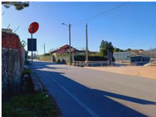
Esterni strada 1

L'intero edificio sviluppa 3 piani, 2 piani fuori terra, 1 piano interrato. Immobile costruito nel 1959 ristrutturato nel 1968.