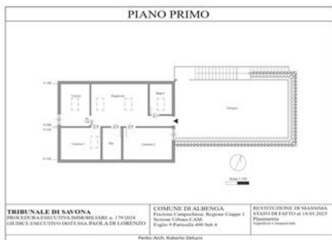
Albenga - Frazione Campochiesa - Regione Ciappe n. 1 - Piano 1 - Fg. 9 Part. 490 sub 4 - Planimetria Stato al 18.03.2025