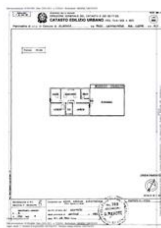
Albenga - Frazione Campochiesa - Regione Ciappe n. 1 - Piano 1 - Fg. 9 Part. 490 sub 4 - Planimetria Catastale