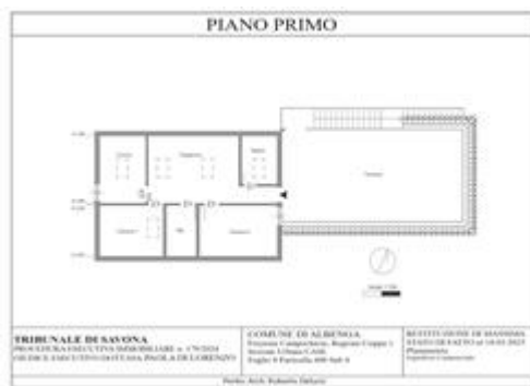
Albenga - Frazione Campochiesa - Regione Ciappe n. 1 - Piano 1 - Fg. 9 Part. 490 sub 4 - Planimetria Stato al 18.03.2025