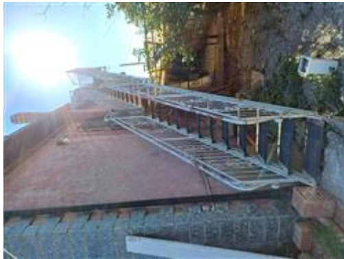
Esterni Scala Accesso